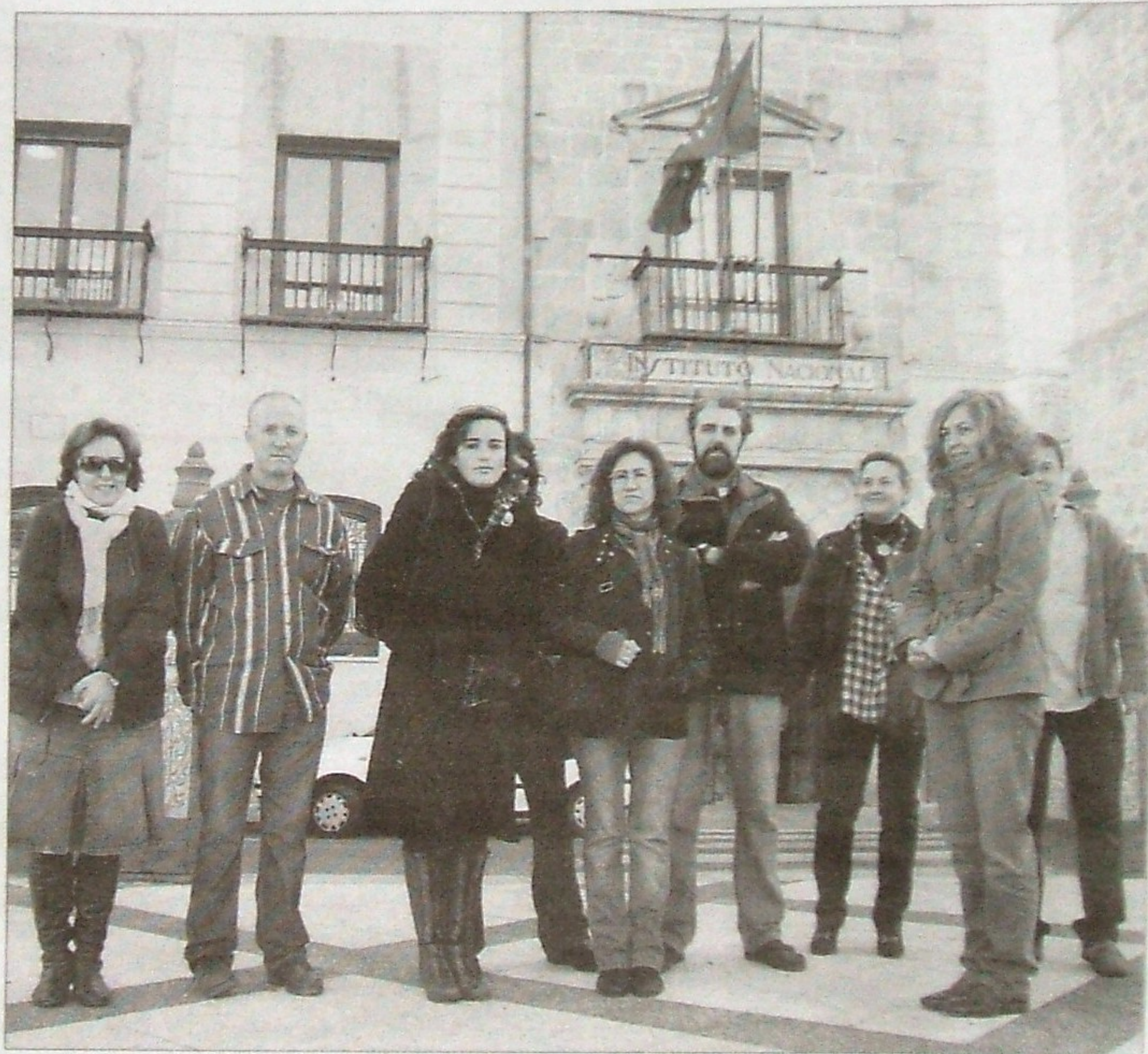
En la imagen, miembros de la asociación de familias numerosas ayer ante la delegación de la Junta.